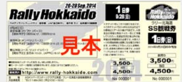
③ラリー北海道チケット